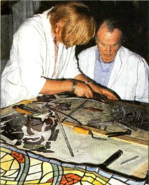
Aller Anfang ist schwer: Beim ersten Umgang mit dem Glasschneider kann man etwas Hilfe gut gebrauchen.